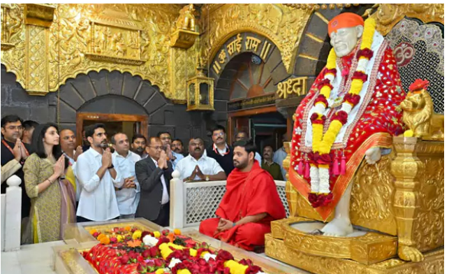
శ్రీ సాయిస్వామి దర్శనం చేసిన మంత్రి లోకేశ్ దంపతులు